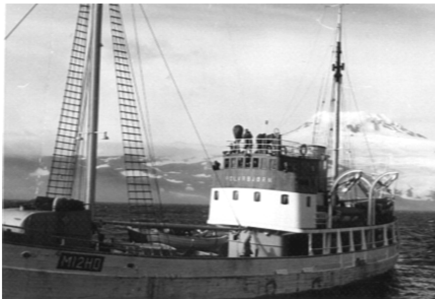
Ishavsmuseets Venner, Postboks 20, 6062 BRANDAL