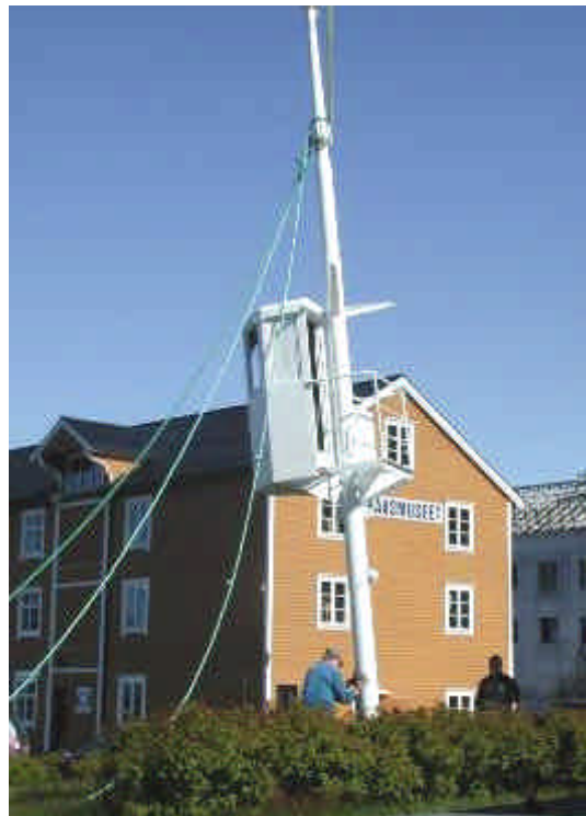
Tønna under montering.