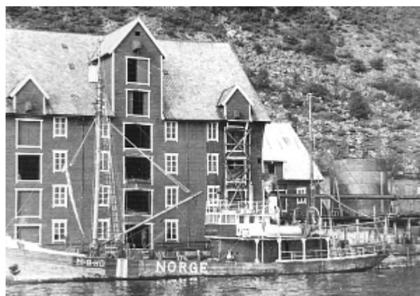
"Signalhorn" ved storebuda i Brandal 1939.