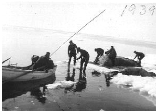
Mannskap på "Signalhorn" på kvalrossfangst i 1939.

Og med dieselmotor kunne skuta rekke over store område utan å bunkre. "Signalhorn" var allereie same året - i 1934 - på ein vitskapleg ekspedisjon til Grønland. Ekspedisjonen var leia av Edward Shackleton, son av den kjende britiske polareventyraren Sir Ernst Shackleton. "Signalhorn" var også på kvalrossfangst nord for Disko-øya på Vest-Grønland før siste krig.