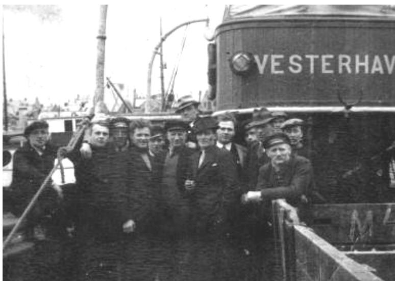
Mannskapsbilete frå turen i 1939.