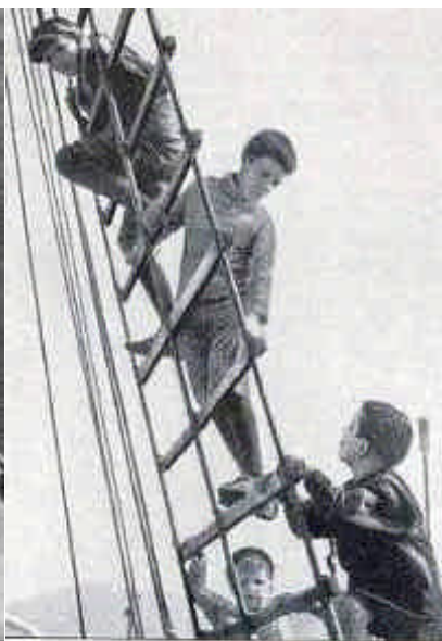
Det unge Norge beskuer oss i Ålesund.