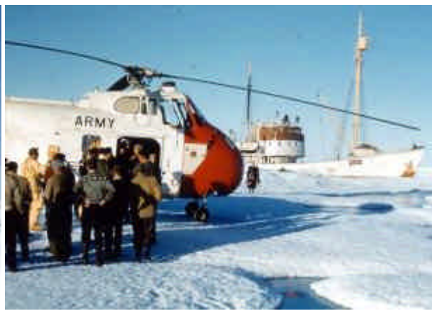
Helikopteret er kome for å ta opp mannskapet.