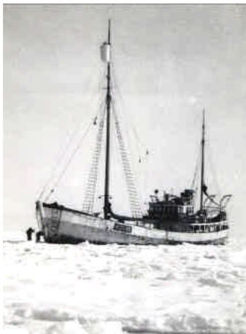
Polarsel i tett is.