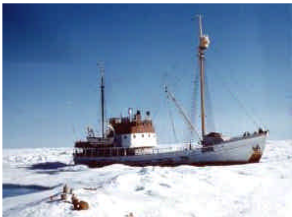
Polarbjørn er knust og heng på isen.

I samband med forliset formidla Ødegaard og Raftevold i Myggbukta avgjerande radiotrafikk begge vegar mellom Polarbjørn og Jan Mayen. Situasjonen som førte til forliset utvikla seg over fleire døgn. Dei to i Myggbukta sat kontinuerleg vakt ved radioen i den tida. Frå sin plass ved radioapparata i Myggbukta opplevde Raftevold situasjonen som klart dramatisk.