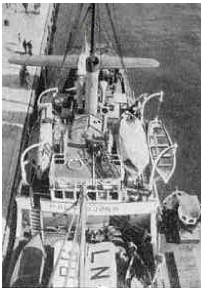
Vi så ut som et ginnsvin da vi forlot Ålesund.

Men det bekymret selvsagt ikke meg, ettersom jeg fant meg vel tilrette i det ekspansive og kreative ishavsmiljöet som på nytt begynte å gro rundt bestefar – og ikke minst oppdaget jeg ganske snart at en jevn strøm av skipperer og fangstfolk kom og gikk til kontoret, som lå lengst nede i huset. De karene interesserte meg for de kunne fortelle utrolige – både spennende og sörgelige historier. Ja, det var bare for meg å gå ned de to trappene til kontoret