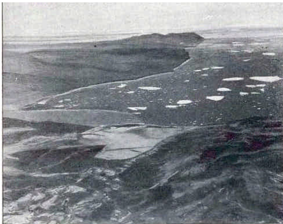
Mackenziebukten fra luften. I midten Balås flyveplass. Inne i viken til venstre Myggbukta radiostasjon.

De spionerte litt og de forsøkte også å markere revir for egen del for å hindre norske observasjoner. Det hendte for eksempel på Sabine-öya der en norsk astronom skulle gjøre målinger for å fastslå om det med astronomiske observasjoner var mulig å måle om avstanden mellom Grønland og det europeiske kontinentet öket eller minket.