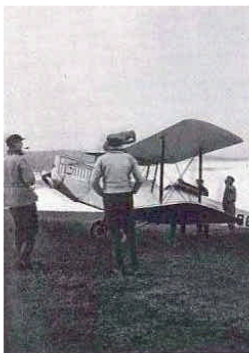
Det første landfly i Eirik Raudes land. Sparta-maskinen starter kl. 2 om natten.